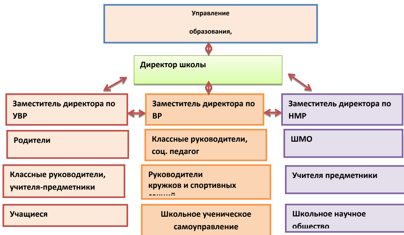
Схема системы воспитательной работы в МБОУ СОШ №4